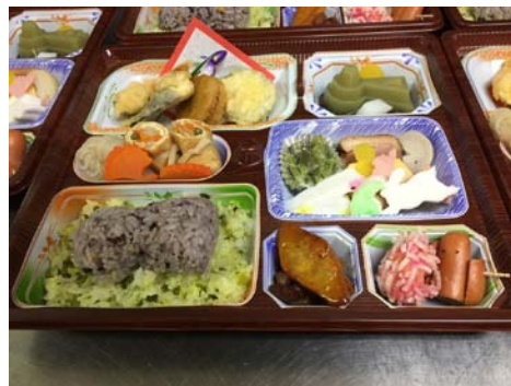
— 市民とめざす 世界遺産 — 古市古墳群「 世界遺産登録応援弁当 (仮称) 」